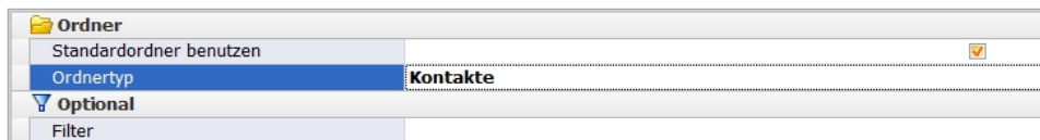
Abb 01: Outlook Einstellungen

Wählen Sie den Outlook Ordner aus, optional können Sie einen Filter definieren.