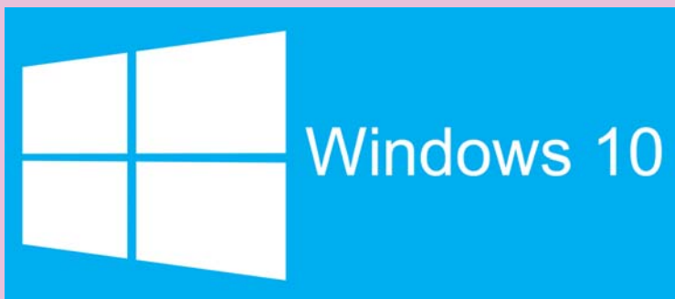
Arbeitsstation mit lokaler Sicherheitsdatenbank