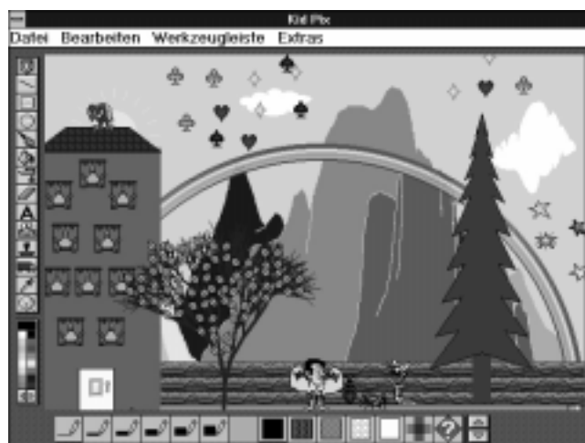
Abb. 4: Kidpix Malprogramm

FRIC, Technische Buchhandlung 1040 Wien, Wiedner Hauptstraße 13