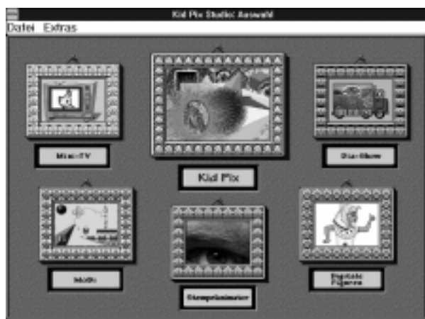
Abb. 1: Programmgruppe

PIX sind mehr als nur Bilder zum Anschauen - es sind Bilder, die sich bewegen! KIDPIX STUDIO beinhaltet faszinierende Methoden, mit denen Kinder ihren Bildern und Dia-Show-Produktionen bewegte Bilder hinzufügen können: Quick Time-Filme! Hunderte von animierten Stempeln, Soundeffekten und musikalischen Klängen beflügeln die Phantasie in ihrer Vielfalt von Kombinationen.