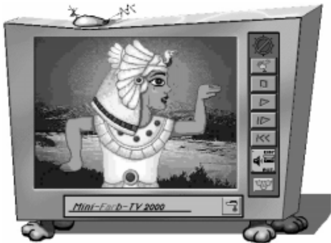
Abb. 2: Media Player

Mit KIDPIX STUDIO von Broderbund Software erhalten junge Multimediaalkünstler ab dem Vorschulalter ideale leistungsfähige Werkzeuge, die kinderleicht und intuitiv zu bedienen sind. Falsch machen kann man eigentlich fast nichts.