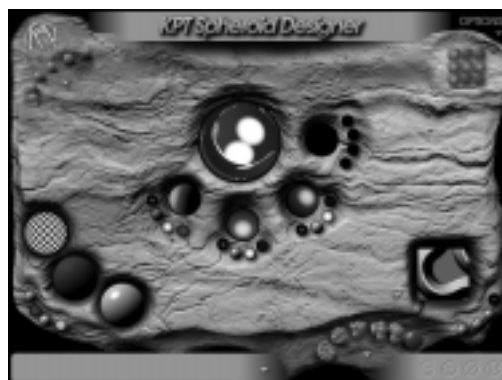
Abb. 4: Pseudoplastische Kugeln