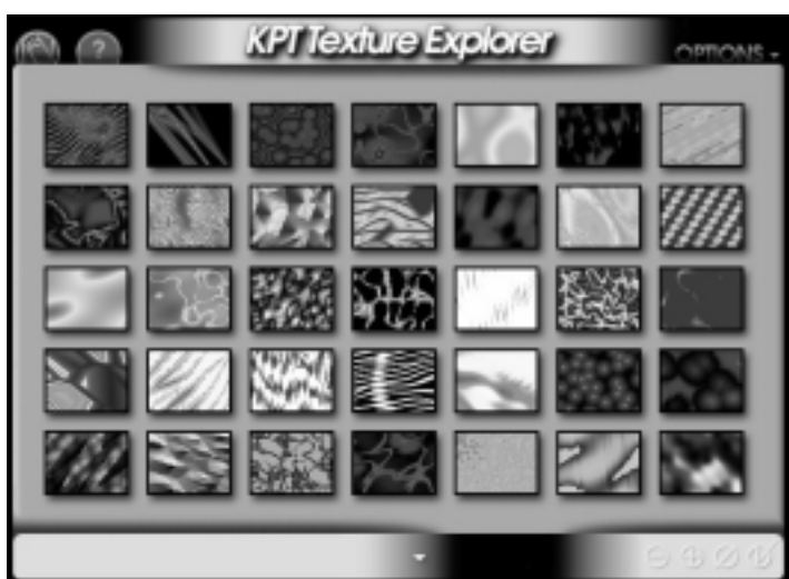
Abb. 2: Algorithmische Texturen

Dafür stößt der Texture Explorer 3.0 in nahezu räumlich wirkende Dimensionen vor, berechnet Strukturen und Hintergründe, basierend auf mathematischen Algorithmen - in relativ kurzer Zeit. In einer Bibliothek sind eine Vielzahl von vorgegebenen Beispielen auswählbar ( Abb. 2 ), die per Mausclick auf jeden vorhandenen Hot Spot der Benutzeroberfläche mutieren - ihre Farbe, Konsistenz, Größe u.s.w. ändern lassen. Im Zusammenspiel mit dem jeweiligen Trägerprogramm (u.a. Adobe Photoshop, Corel PhotoPaint, Fractal Design Painter, Fauve Matisse, Micrografix Picture Publisher) werden auf diese Weise Bilder erzeugt, die im Resultat aufwendiger aussehen, als sie entstanden sind ( Abb. 3 ).