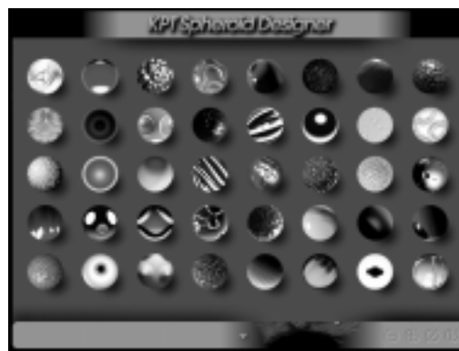
Abb. 5: Spheroid Designer Vorschau

Mit dem KPT Spheroid Designer ( Abb. 4 ) steht ein neuartiger Generator zur Verfügung, der mit algorithmischen Texturen sowie importierten Bitmaps pseudo-plastische Kugeln mit Licht- und Schatteneffekten entwirft, unbegrenzt variabel in ihren Oberflächeneigenschaften ( Abb. 5 ).