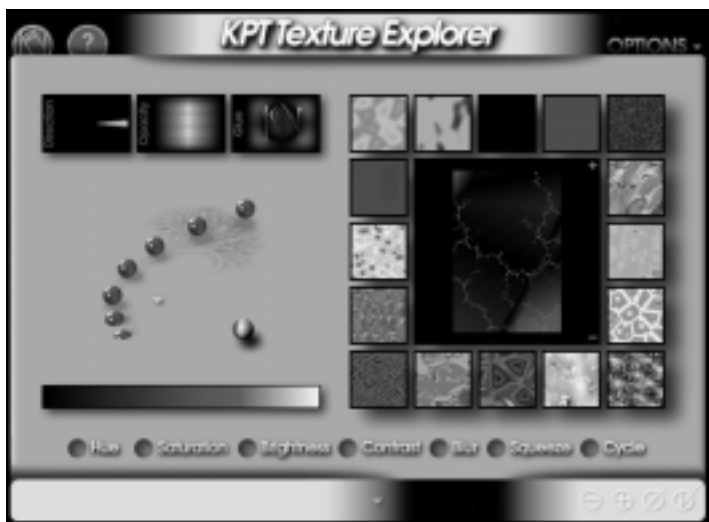
Abb. 1: KPT Texture Explorer 3.0

Die KPT-Serie ( PCNEWS edit Nr.47/96) wurde in der neuen Version 3 nicht nur um neue Werkzeuge erweitert, sondern in bekannten Funktionen etwas abgewandelt, teilweise sogar eingeschränkt. So lassen sich einerseits Filterwirkungen im einzelnen viel genauer einstellen, durch größere Vorschaufenster und hinzugekommene Regler ( Abb. 1 ), andererseits sind manche Möglichkeiten leider gänzlich entfallen - so z.B. das Erzeugen von Fraktalen (Fraktalforscher) oder das Generieren von Mustern für nahtloses Kacheln (wie im alten Strukturforscher).