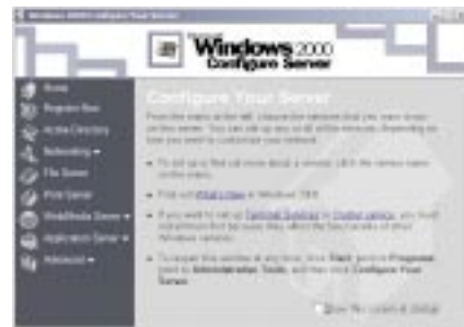
MMC: Manage Computer

Aufgabe in der MMC (Microsoft Management Console) vorgenommen.