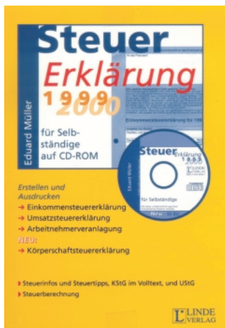
Dipl.-Kfm. Eduard Müller; Linde Verlag Wien; Programmierung: dsSoft Doppler & Co Software KEG

Jedes Jahr flattern die bunten, aber trotzdem nicht schönen Steuerformulare ins Haus. Der moderne Mensch greift kopfschüttelnd zum Bleistift, um besser radieren zu können, und versucht nach – mehr oder weniger – bestem Wissen und Gewissen zahlreiche Eintragungen in diese Formulare zu machen. Was ist naheliegender, als ein elektronisches Formular zu verwenden, in dem korrigiert werden kann. Also freue ich mich schon auf Lindes Lohnsteuerprogramm.