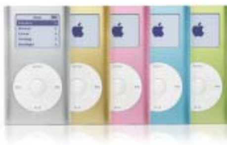
iPod Mini Family

Seit Jänner 2004 bietet Apple auch den kleinen Bruder des iPod an, den iPod mini. Er ist in fünf Farben erhältlich (Gold, Blau, Grün, Silber, Rosa), ist kleiner und leichter als der iPod, kann jedoch nur 4GB Daten aufnehmen. Er wird ohne Dock ausgeliefert und per FireWire bzw. USB mit dem Mac oder dem PC verbunden. Die Akkulaufzeit beträgt 8 Stunden. Von den Funktionen entspricht der iPod mini dem iPod.