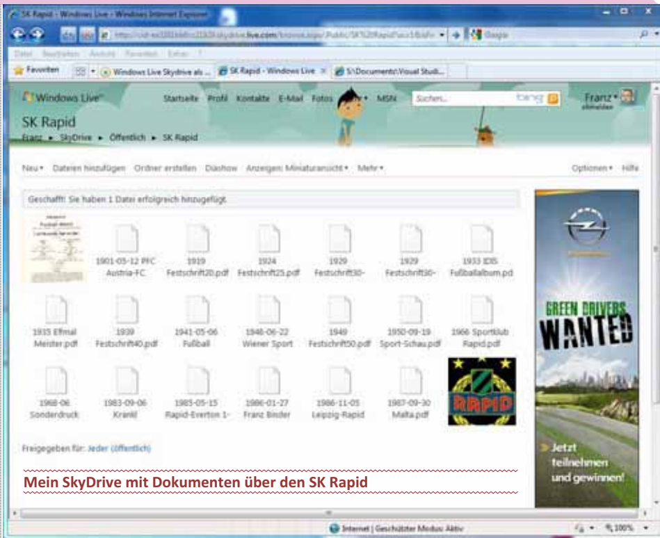
Mein SkyDrive mit Dokumenten über den SK Rapid

Man kann den SkyDrive aber auch im Windows-Explorer integrieren. Man installiert das Zusatz-